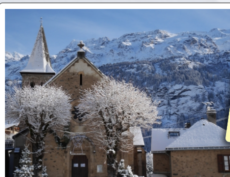
Église de Vaujany