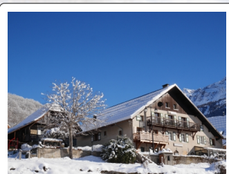
Vue du dessous