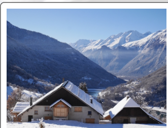
Vue du dessus