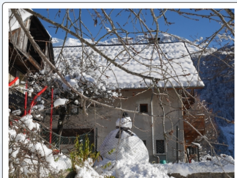
Gros gros bonhomme de neige