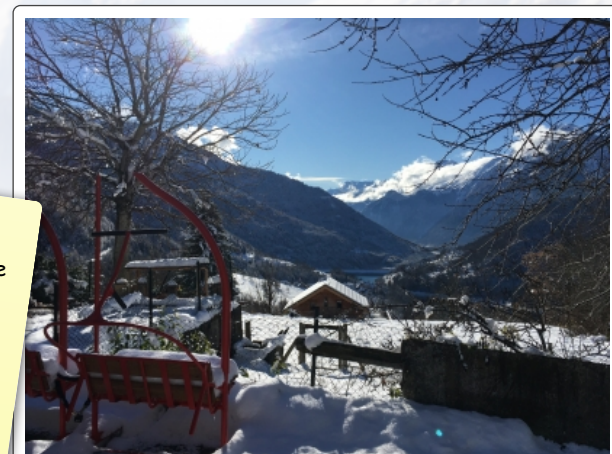
Détente avec vue