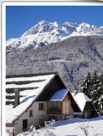
Vue de derrière