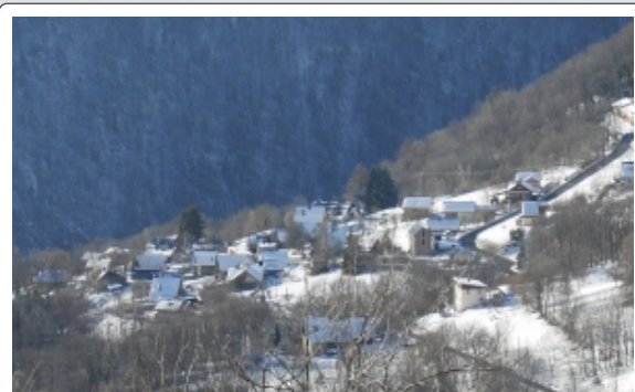
Vue d'en face... Trouver l'auberge ?